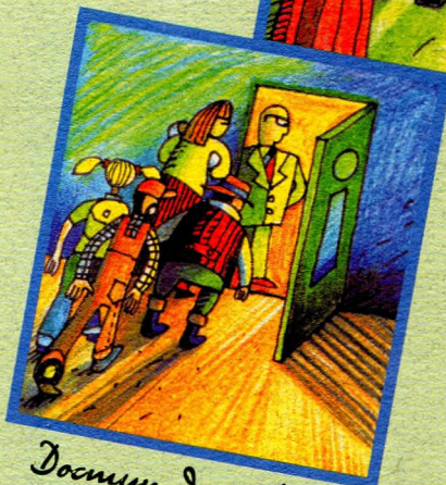
Доступ да інфармацыі