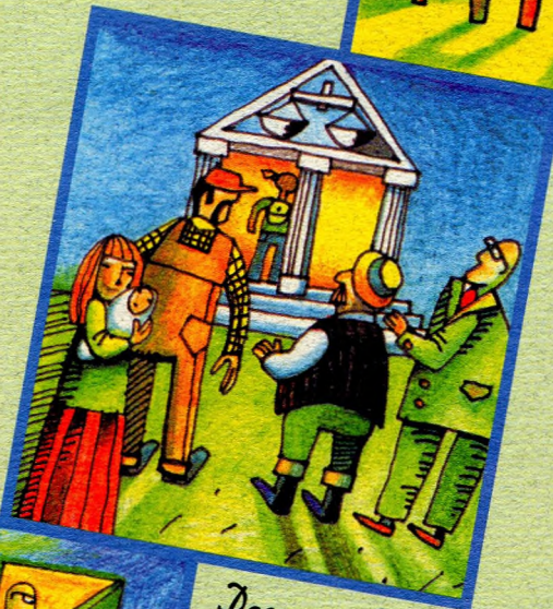
Доступ да правасуддзя