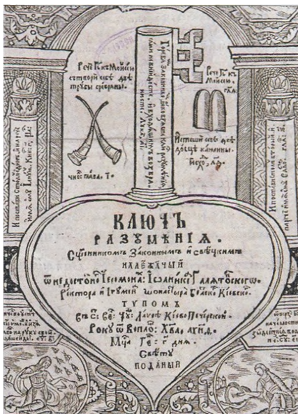
[33] Юнацькі роки й освіта