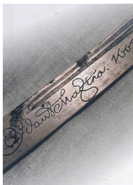
[55] Щаблями службової кар'єри