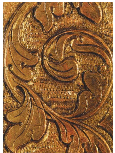
[139] ПОКРОВИТЕЛЬ МИСТЕЦТВ