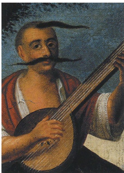
[17] Рід. Мала Батьківщина