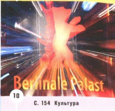
10 С. 154 Культура