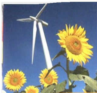
С. 106 Довкілля, клімат, енергетика