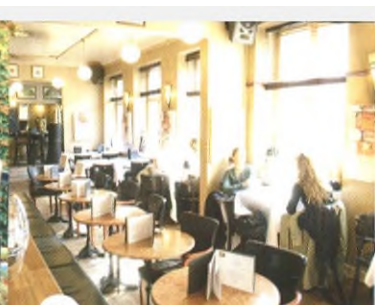
11 С. 176 Сучасне життя