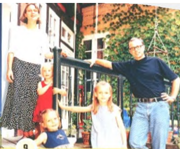
9 С. 134 Суспільство