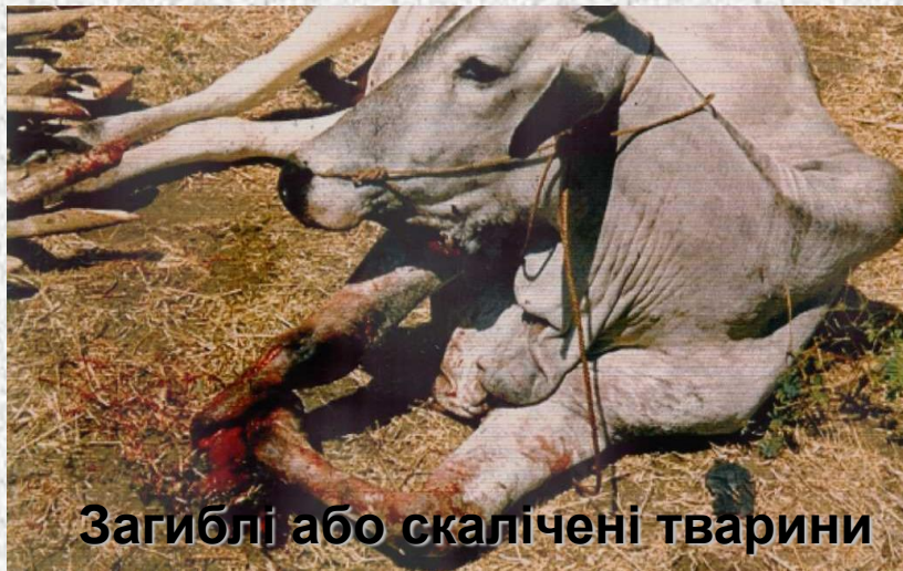
Загіблі або скалічені тварини