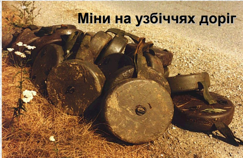
Міни на узбіччях доріг