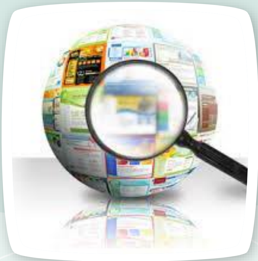
Допомога пошукових систем