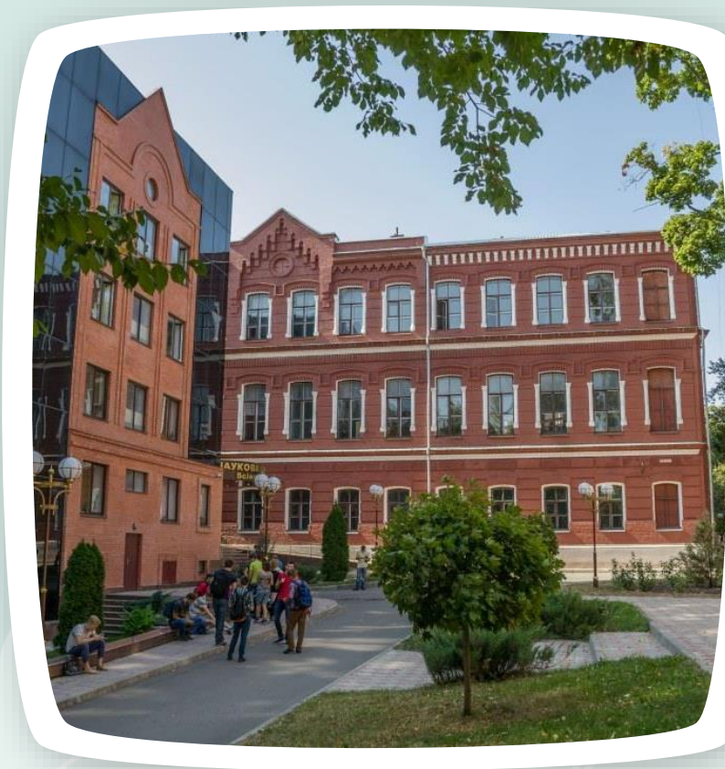
Бібліотека НТУ «ХПІ»