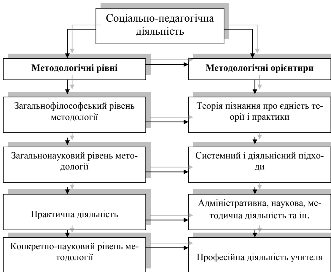
Рис. 1. Методологічні рівні дослідження соціально-педагогічної діяльності (згідно із теорією В. Краєвського)

На основі методологічного принципу пізнання реальної дійсності про єдність теорії і практики вдаємося до проектування соціально-педагогічної діяльності на тлі відповідного середовища (рис. 2).